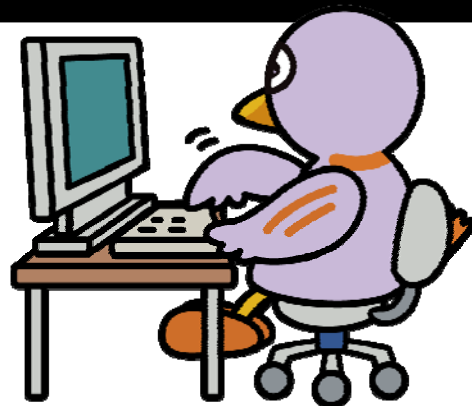
埼玉県マスコット コバトン

ネットショップを立ち上げたいと考えている方を対象に、ネットショップを開店するまでの準備や契約、ネットショップの作り方、売上につながる運営の方法等、体験を交えて学びます。全5回の連続受講は勿論、必要な講座のみの受講も可能です。